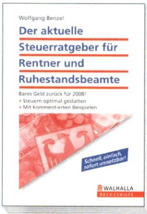
176 Seiten, Paperback ISBN 978-3-8029-3823-8 9,50 EUR