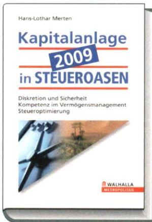
304 Seiten, gebunden ISBN 978-3-8029-3429-2 29,90 EUR